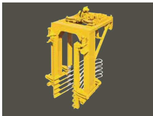
1989, Tête ARC Reconnue comme la plus douce du marché