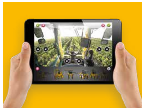
2016, GREGOIRE G4 & G5 Spécialiste de la vigne étroite