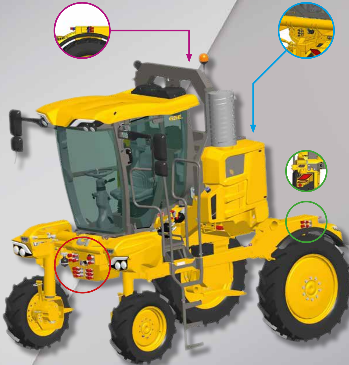
Répartition des distributeurs hydrauliques

Des distributeurs ont été placés tout autour du porteur afin de permettre un branchement rapide de tous les outils.