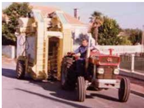
1978, GREGOIRE GMH Fiabilité prouvée